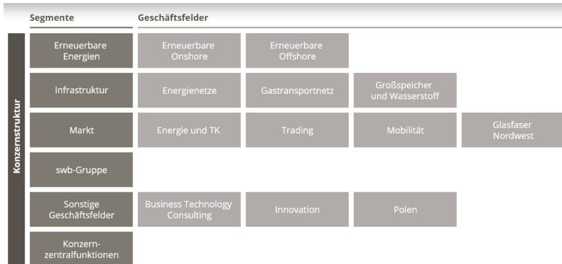
Abbildung 1 - Geschäftsbereiche des EWE-Konzerns (Stand 2024)

Eine Darstellung der Geschäftsbereiche des Gesamtkonzerns während des Berichtszeitraums mit seinen wesentlichen Tochtergesellschaften sowie den assoziierten Unternehmen ist im nachfolgenden Organigramm dargestellt: