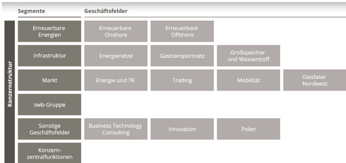
Abbildung 1 - Geschäftsbereiche des EWE-Konzerns (Stand 2025)